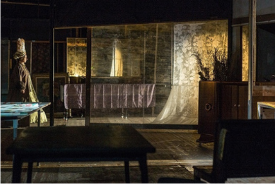
Item , Théâtre du Radeau, François Tanguy