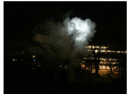
Projection sur vapeur d'eau / arbre, Tony Oursler