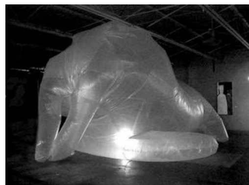
Structure pneumatique mobile, Dominic Kießling